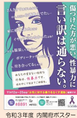
令和3年度 内閣府ポスター