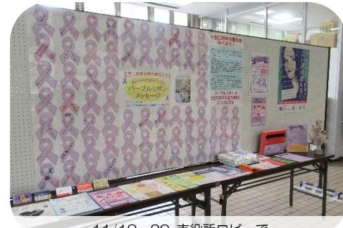
11/18～29 市役所ロビーで 昨年寄せられたメッセージを展示しました

いただいたメッセージは、年内はにんじんサロンに掲示し、来年2月6日にテクスピア大阪で開催する『フォーラム in いずみおおつ 2022』の会場内で展示する予定です。